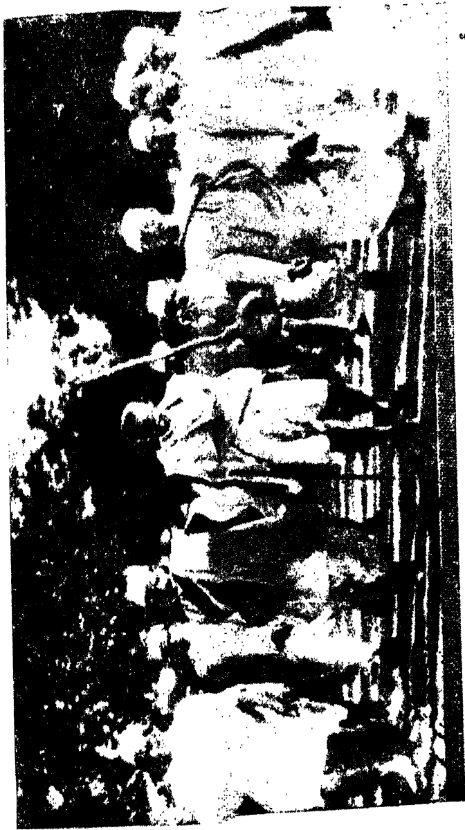
జూజియాన్స్ ఆర్ బ్యాండ్ సామగ్రిని పరిశీలించిన మహారాజగారి