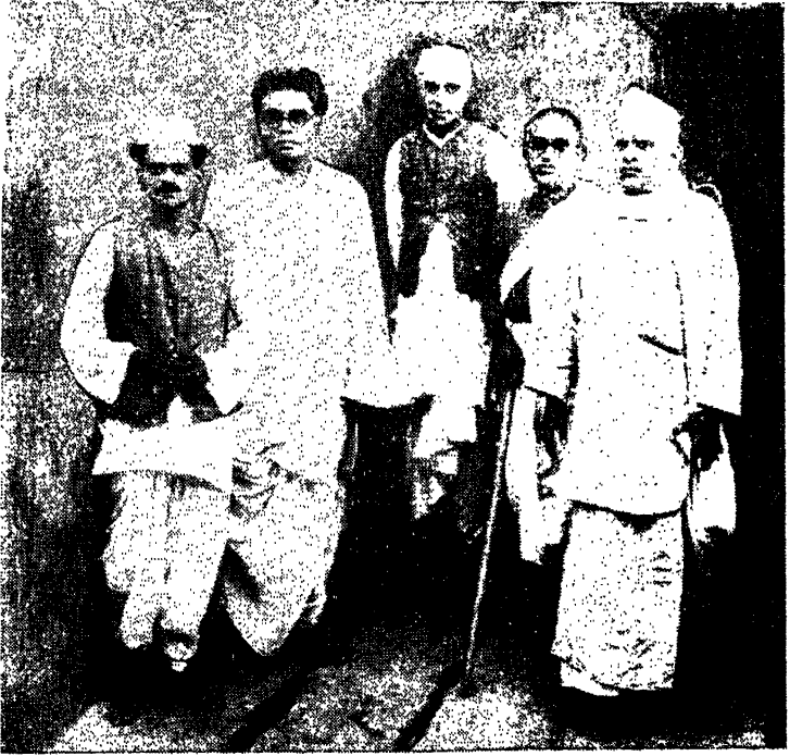
1. పండిత జవహర్లాల్ నెహ్రూ, 2. అంగుజూరి ప్రకాశం, 3. వంశా సూరిశాస్త్రి, 4. ఋతుసు సాంబమూర్తి 5. అయ్యదేవర రాజేశ్వరరావు.